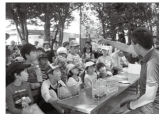
三区町環境保全隊