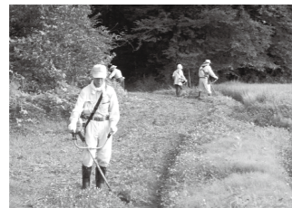
無栗屋自然保全会