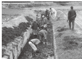
越堀自然を守る会