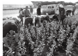
鍋掛南部地区環境保全隊