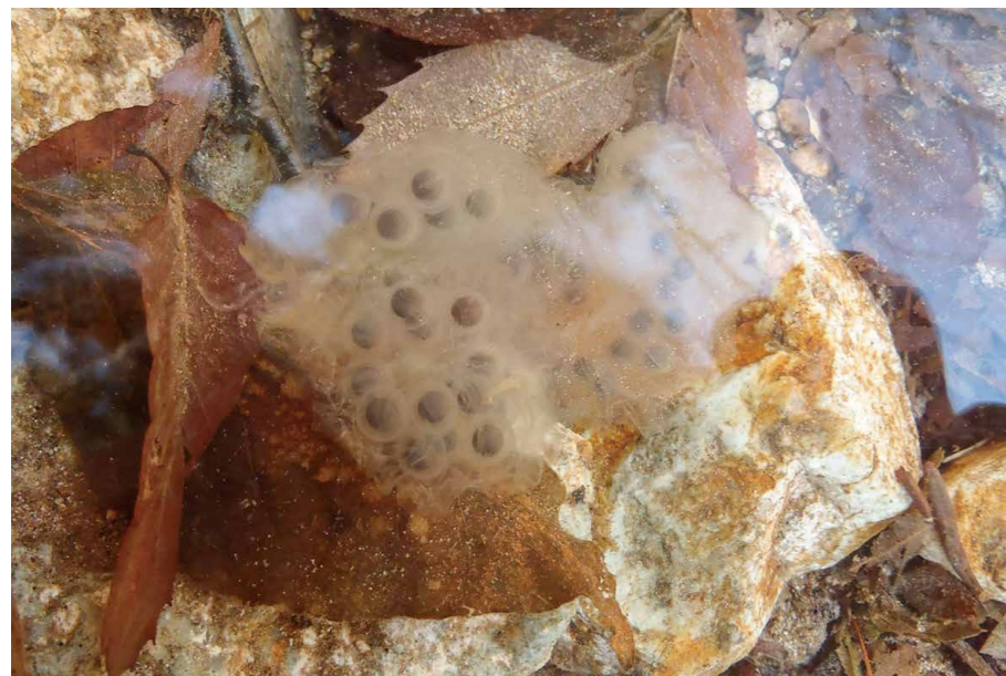
卵のう(箱の森プレイパーク)