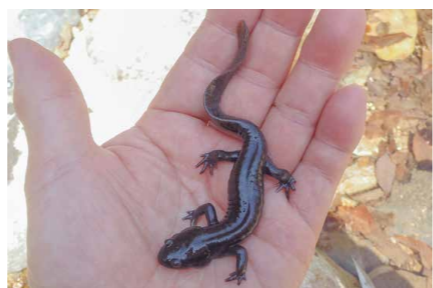
トウホクサンショウウオ

市内に生息するサンショウウオ3種のうちの1種で、市・県・環境省のレッドリストに記載されています。体長9cm～14cm。現在は、気候変動や環境変化で産卵地や幼生の生育場所が減り、生息数の減少が危惧されています。