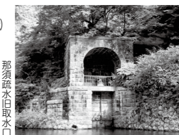
那須疏水旧取水口