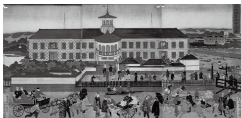
築地海軍英学寮図