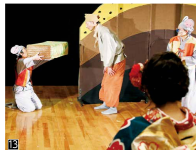
この日の演題は「おむすびころりん」

小学生の時に観た私たちの劇を、人生の節目の成人式で観たいと上演の依頼があったときはうれしかったですね。成人式で上演するのは初めてですが、当時を思い出して、劇を楽しんでもらいたいですね。