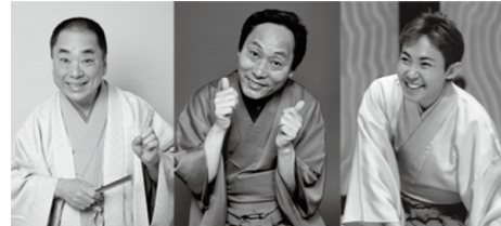
三遊亭好楽 桂米助 林家三平