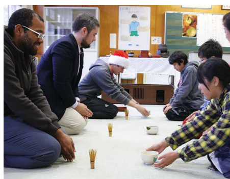
◀子どもたちとALTがペアを組み、交代でお茶をたてる。初めて茶道を体験したという子どもも多かった。