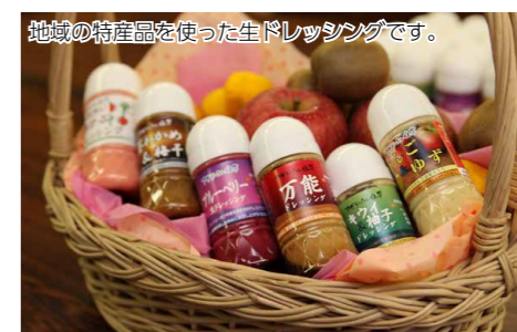
地域の特産品を使った生ドレッシングです。