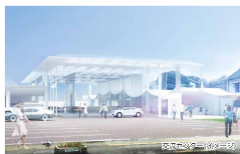
交流センター(イメージ)