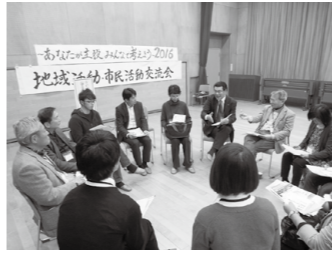
昨年も大勢の人が参加し、意見交換などを行いました