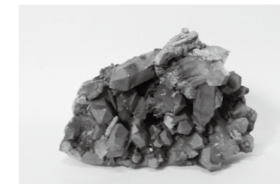
緑水晶(栃木県立博物館蔵)