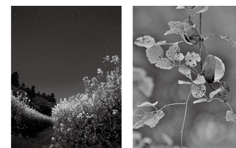
その他の出展作品 (一部抜粋)