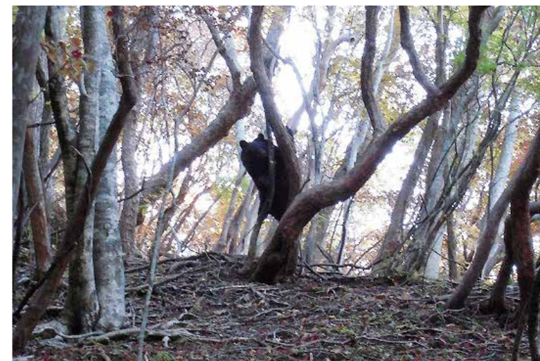
投稿者 熊に嫌われている老人 さん(70代男性 東三島) 撮影場所 中塩原地内(撮影日 H26.10)

中塩原の山を歩いていたら、木の後ろから熊が顔だけ出してこちらを見ていました。その熊はカメラを向けるとさまざまなポーズをとってくれました。