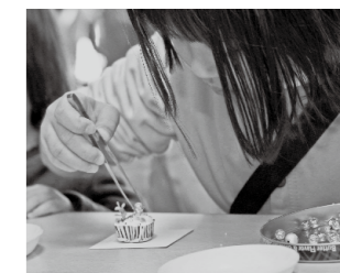
デコスーツマグネット作り