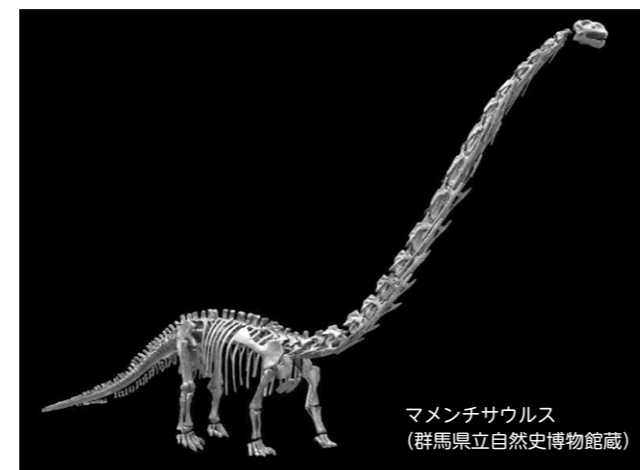
マメンチサウルス(群馬県立自然史博物館蔵)