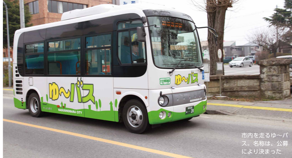
市内を走るゆ〜バス。名称は、公募により決まった

市内の主な公共交通は鉄道、タクシー、そしてバスの3種類。特にゆ〜バスは平成25年の路線再編後、利用者数が増加傾向。車での移動に慣れ過ぎていて、自分の生活と乗り物との関係性を見つめ直しては——。