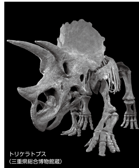
トリケラトプス (三重県総合博物館蔵)