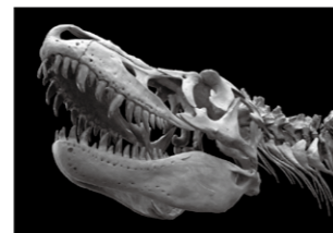
タルボサウルス (国立科学博物館蔵)

今から約2億3千万年前に出現した恐竜は、世界中のあらゆる環境に分布を広げ、多様な形や生態をもつ一大グループへと繁栄を遂げました。本展では、主要なグループとその特徴を分かりやすく紹介します。トリケラトプスやタルボサウルス、マメンキサウルスなどの全身骨格をはじめ、貴重な実物化石や生態復元模型、さらに本物の化石に触れるコーナーを通して恐竜の魅力に迫ります。