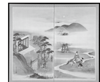
平家物語 小督と仲国 (高久隆古作)

▶とき…7月23日(日)まで ▶観覧料…無料 ▶問い合わせ 日新の館 ☎(64)1343