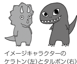
イメージキャラクターのケラトン(左)とタルボン(右)