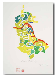
《リンツの望み》 作品の一部