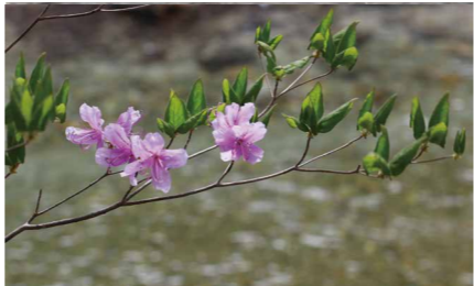
トウゴクミツバツツジ

山地の林床に生え、高さは40～70cm。茎頂に直径1cmの黄緑色の花をまばらにつける。葉は3個ずつの複葉で2～3つの浅い切れ込みがある。