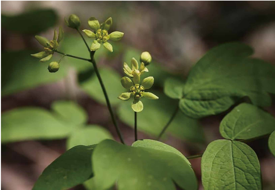
ルイヨウボタン 撮影日時:2013.5.3 撮影場所:木の俣園地