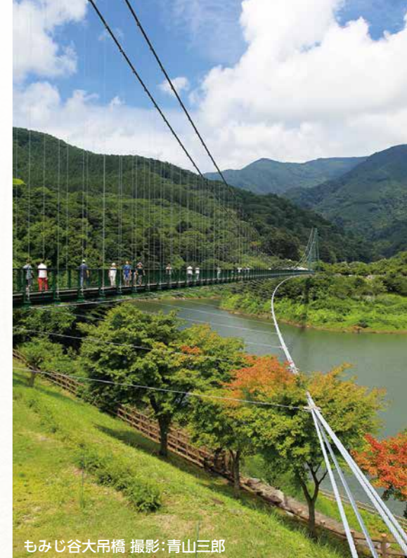
もみじ谷大吊橋

鳥たちのさえずりが届けてくれる春の便り。 足元に咲く小さな花々が まちをにわかに色づけ始めます。 そして緑の渓谷、新鮮な野菜、安らぎの湯。 那須塩原の新しい魅力 ヒカリ を見つけてみませんか。