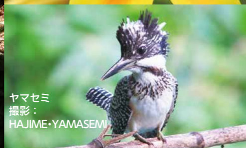
ヤマセミ