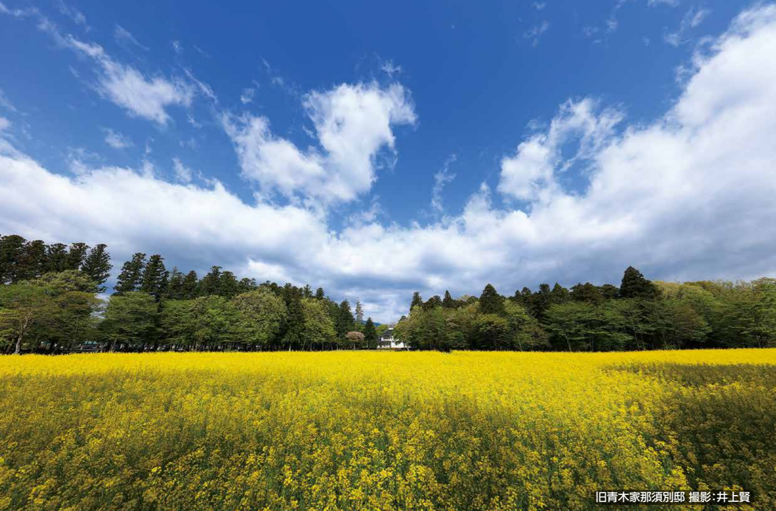
旧青木家那須別邸