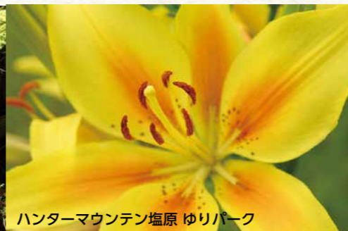
ハンターマウンテン塩原 ゆりパーク