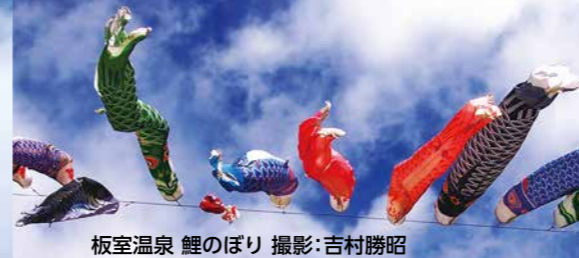
板室温泉 鯉のぼり