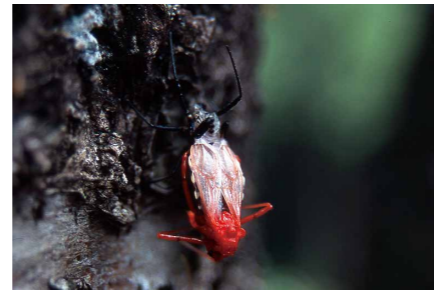
羽化直後の姿(下が頭)

体長16～24mmの外來のサシガメ類。和名の由来は、腹部の白黒の縞模様を力士の化粧まわし、もしくは行司の軍配に見立てたなど諸説ある。公園や学校、道路などに植えられた木の幹にすることが多い。手でつかむと刺されることがあるので要注意。