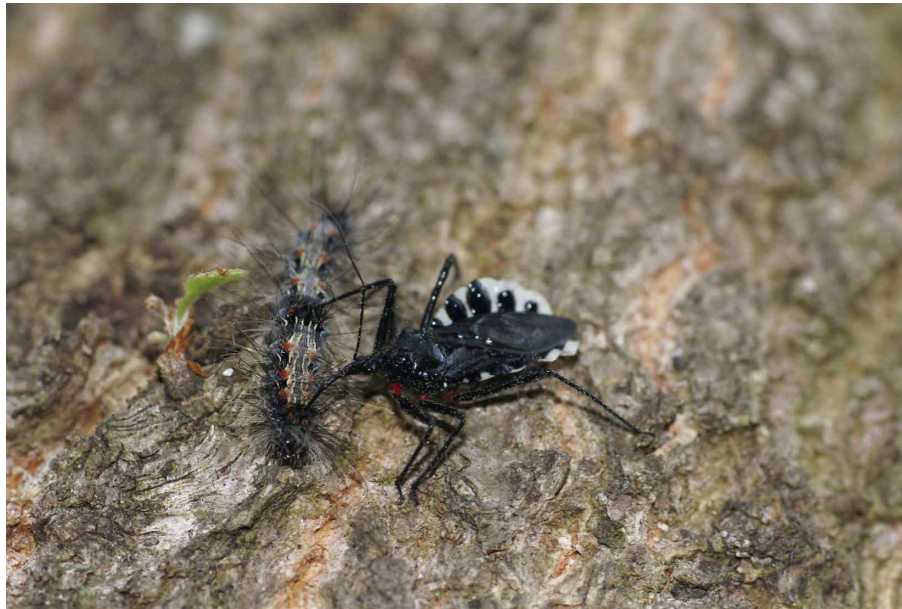
毛虫を捕らえたヨコヅナサシガメ 撮影日時:2007/5/19 撮影場所:千本松