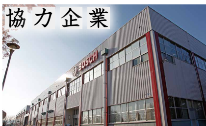
ボッシュ株式会社 栃木工場(北赤田1588-1) 【業種】自動車部品・附属品製造業 【業務の内容】ブレーキ制御システム・自動車用センサーの製造 【従業員数】465人 【問い合わせ】☎0287(37)4601