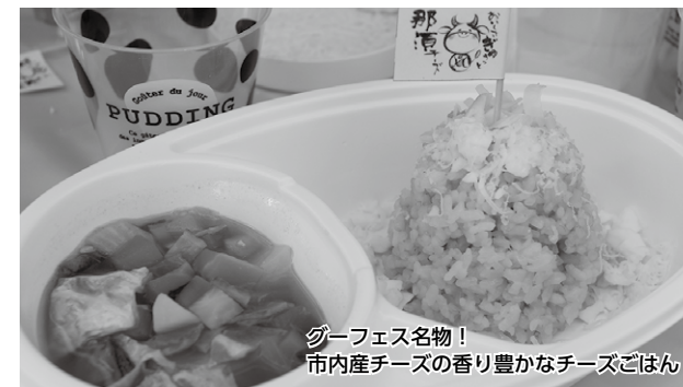
グーフェス名物! 市内産チーズの香り豊かなチーズごはん