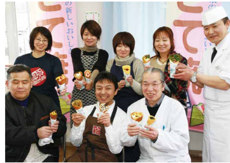
新作を手にする各店の皆さん

調査票は調査員が直接配布するか、国が郵送します。調査員が訪問する場合は必ず「調査員証」と「従業員腕章」を身につけています。また、口頭での調査は行いません。不審な電話や訪問があった場合は回答しないでください。不審に思った場合は市民協働推進課に連絡してください。