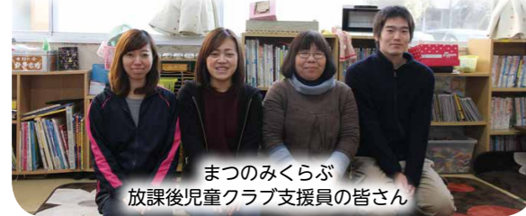
まつのみくらぶ 放課後児童クラブ支援員の皆さん

「ぶつかりあって大きくなれ」です。 子どもたちの成長を手助けできるこの仕事は、とてもやりがいがあります。モットーは「ぶつかりあって大きくなれ」です。