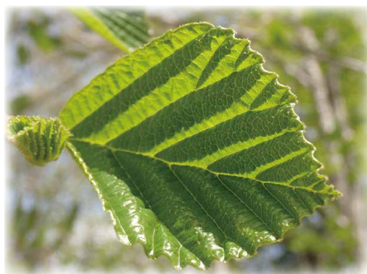
オオバマンサクの葉