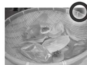
タマネギの皮などはぬらさずに