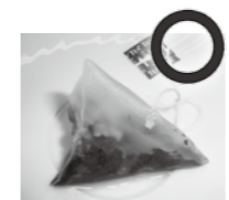
すぐに捨てず、数時間置いておくだけで効果あり