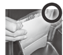
はさんで簡単に水が切れる便利グッズ(生ごみ水切り器)