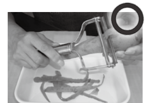
にんじんやいも類などで実践