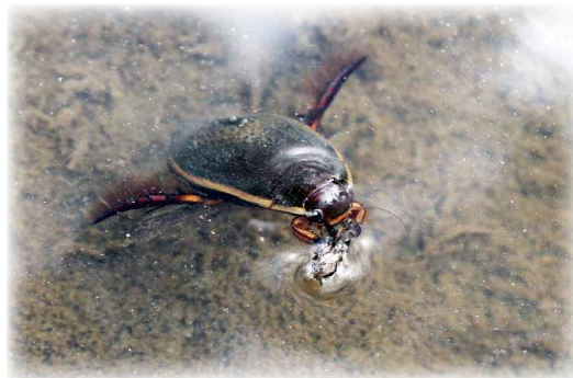
前あしを使って器用に獲物を食べるゲンゴロウ