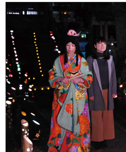
点灯式での一幕。かぐや姫が妙雲寺の参道を歩く様は昔話ながら

竹灯籠の点灯は1月下旬に新湯地区や元湯地区でも開始され、こちらも2月いっぱい楽しめます。