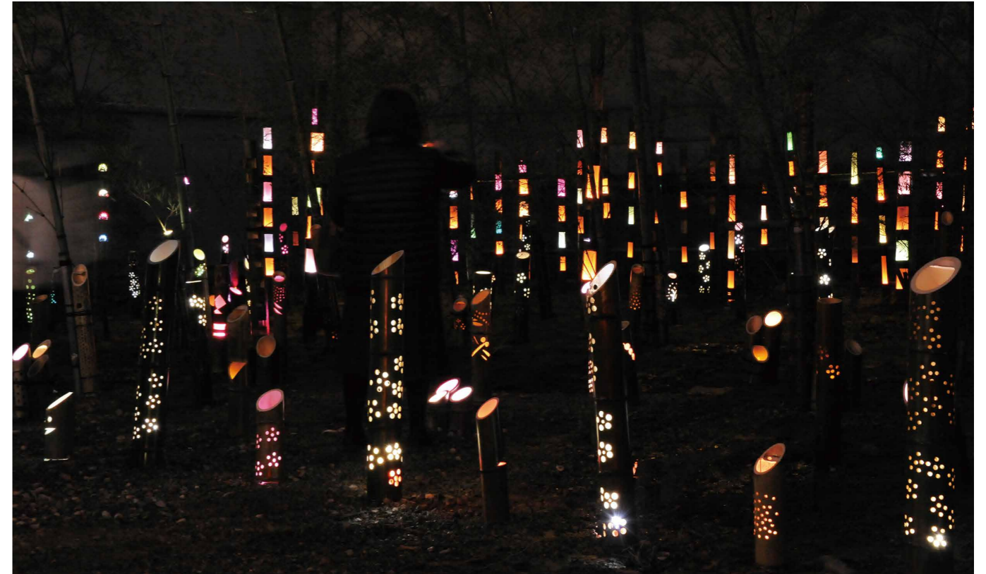
灯籠から漏れる明かりが幻想的な雰囲気を醸し出します

ホールの最後列に座っていた男性は「オペラの鑑賞は初めてだが、演者の声量に圧倒された」と話していました。次回の公演は、オペラによってどんな物語が語られるか必見です。