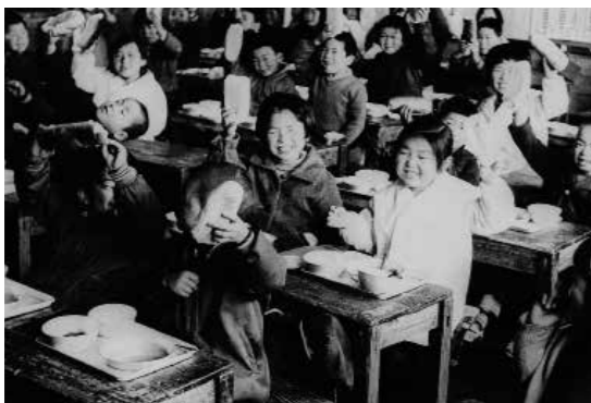
三島小学校で完全給食開始(昭和37年)