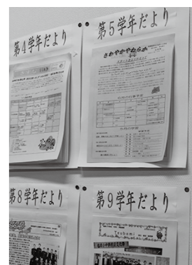
塩原小中学校の学年は1～9学年となっている