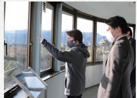
橋本聖子元大臣による事前キャンプ予定地の視察