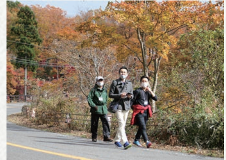
ONSEN・ガストロノミーウォーキング