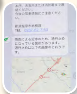
大雨時、道路冠水による通行止めの場所を地図で送付