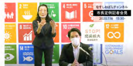
市長定例記者会見の動画配信