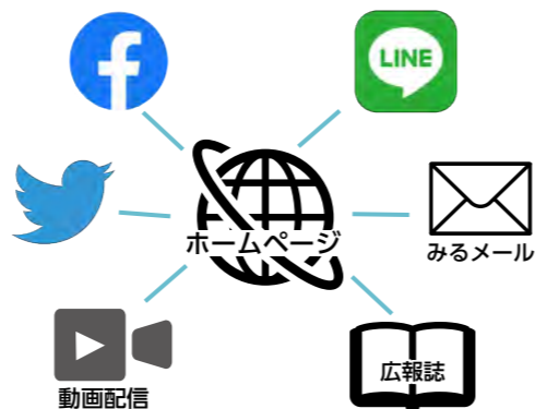
ホームページが情報発信の起点に