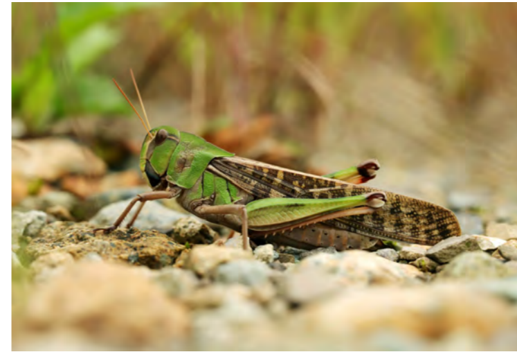
トノサマバッタ 撮影日:2020.9.13 撮影場所:蛇尾川(上横林)

今年、東アフリカから南西アジアにかけて、サバクトビバッタが大発生し、農作物を食べ尽くして深刻な被害をもたらしました。普段、トビバッタの仲間は単独で生活しますが、さまざまな気象条件が重なると急激に個体数を増やして群れで行動するようになり、体の色や大きさ、翅の長さなど姿形も変わります。