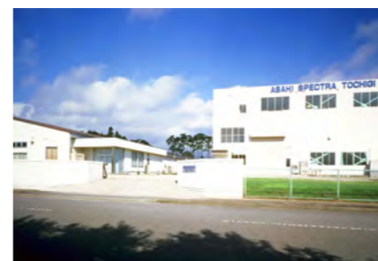
朝日分光 株式会社 栃木工場(北赤田1576) 【業種】製造販売業 【業務の内容】光学機器および光学部品の製造・販売 【問い合わせ】☎0287(37)4000

光学フィルター・ミラーなどの光学薄膜部品や測定器などの光学機器を設計、製造、販売している朝日分光株式会社。栃木工場では、すべての製品の設計と製造を担い、さまざまな業界へ提供しています。 自分の研究に近いことが決め手 小さい頃から星に興味があり、大学では天文学を専攻しました。そこでは、宇宙の星の研究からナノレベルの物質の研究もしていました。在学時は研究者としての道も考えましたが、地元で光学を扱う企業が存在を知り、光学分野での就職に天文学的な運命の出会いを感じ入社を希望しました。 効率的なものづくりのために 私は入社時から成膜部という部署に所属し、光学フィルターなどの設計を主に行っています。光学フィルターといっても皆さんピンとこないと思いますが、身近にある光はさまざまな色が交じりあってできていて、その色のことを波長と呼んでいます。ガラスに特殊な薄膜をコーティングすることで特定の波長だけ抽出することができます。フィルターを製造しています。コーティングする薄膜の厚みは、顧客企業の求める波長に応じたナノレベルで調整する必要があります。大学時代からナノサイズの単位に慣れていたので仕事を