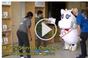
▲「みるる」でしりとりに挑戦！

今年はサマースクールやなしお博が中止となり、皆さんと触れ合う機会が減ってしまい、とても残念です。その代わりに、市公式YouTubeチャンネルで私たちの作った動画を公開しています。その名も「More More English with ALTs」！ 私たちと一緒に英語を使って料理や歌、クイズを楽しみましょう！