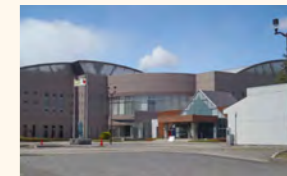
にしなすの運動公園