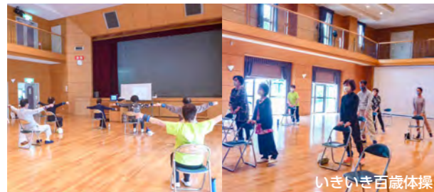
いきいき百歳体操