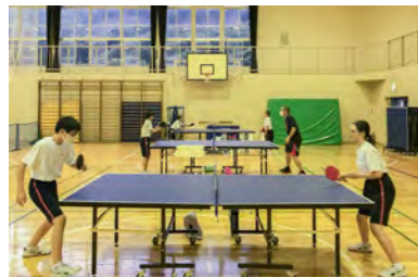
◀ある日の練習風景をパシャリ。皆、真剣に取り組んでいます！

部員全員が初心者という状況でスタートしましたが、生徒たちの真剣な練習態度や顧問の先生の的確な指導もあり、とても良い形で練習を行うことができている。日に日に成長していく生徒たちの姿に、自分自身とても感心させられます。