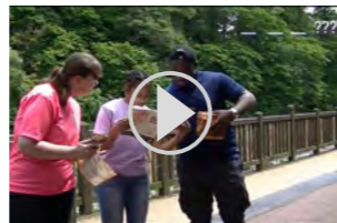
▲塩原で宝探しに挑戦！