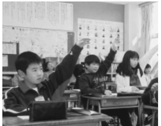
35人学級実現のため教科別指導講師や学校生活適応講師など103人を雇用