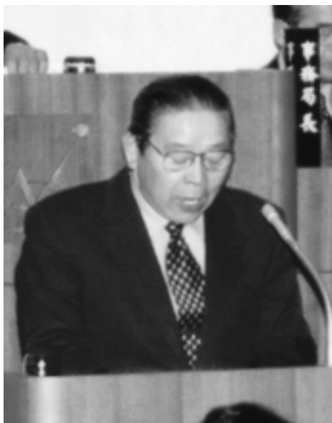
3月議会で市政運営方針を述べる市長