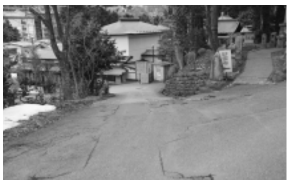
歩いて楽しむ温泉街周遊道整備の予定地

「快適な生活空間づくり」では、那須塩原駅構内のバリアフリー化を目指し、ホームにエレベーターを設置するための支援を行うほか、防犯灯の