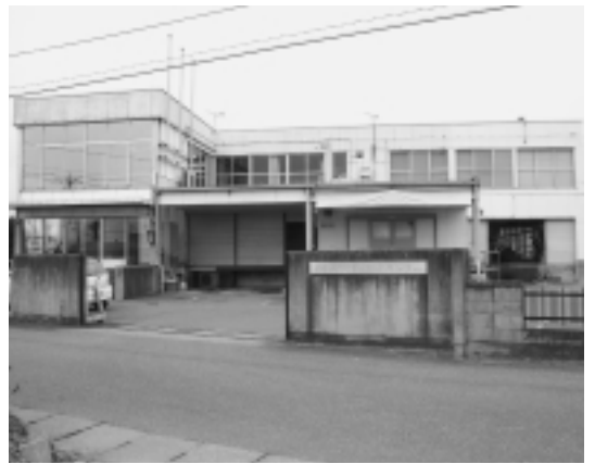
建て替えが予定される西那須野学校給食共同調理場