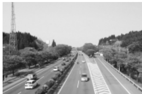
（仮称）黒磯インターチェンジ予定地周辺

環境面では、何と云っても「自然と共生したまちづくり」を進め、那須塩原市のシンボルでもある「緑豊かな自然と美しい景観」を次代に引き継いでいかなければなりません。そのためにも、計画的な土地利用のもとで、秩序ある開発を推進していくと同時に、新