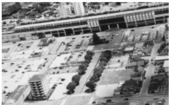
区画整理が進む那須塩原駅前

大きく寄与するものでありますので、できるだけ早い時期に策定したいと思っております。なお、この二つの基本計画は、密接に関連いたしますので、一体的に進めてまいりたいと考えております。 また、広域拠点、地域拠点の整備といたしましては、JR那須塩原駅西口の土地区画整理事業では、17年度に西地区の整備が完了する予定でありますので、北地区の整備に重点化することとし、一般会計と特別会計で、合わせて約六億八千万円を投入し、事業の一層の推進を図ります。 また、西那須野地区におきましては、まちづくり交付金