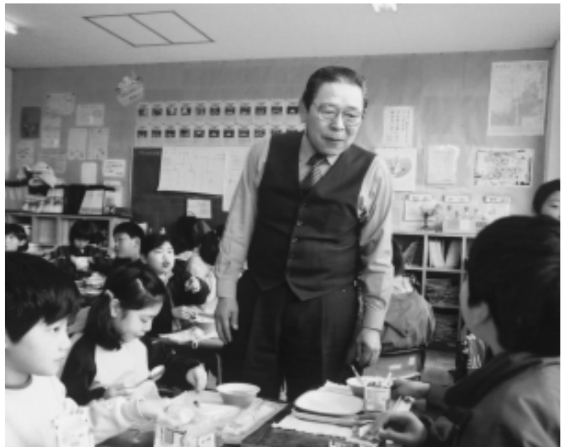
いっしょに給食を食べながら子どもたちと話しをする市長

農業では、関係機関との連携の中で特産品づくりなどを推進し、将来性のある首都圏農業の確立を目指していく一方、生乳生産本州一を誇る酪農に關しましても、課題であるふん尿対策に鋭意努力しながら生産の拡大と安定経営を目指してまいります。