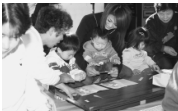
子育て支援コーディネーターを新たに雇用

「健やかに安心して暮らせる社会づくり」では、高齢者や障害者など、福祉各部門計画の上位に位置する計画として地域福祉計画を策定します。子育て支援では、子育て支援コーディネーターを新たに雇用し、子育てに関する相談や情報の集約・提供など、子育て支援機能の充実を図りたいと思っております。