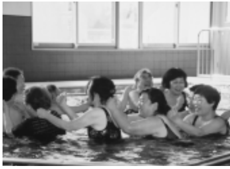
介護予防施設シニアセンター（鍋掛）

福祉の基本は子どもからお年寄りまで、年齢や障害にかかわらず、だれもが安心して暮らせる地域社会を作り上げていくことだと思っております。