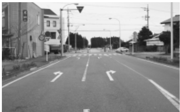
都市計画道路3・4・2中央通り

大きく寄与するものでありますので、できるだけ早い時期に策定したいと思っております。なお、この二つの基本計画は、密接に関連いたしますので、一体的に進めてまいりたいと考えております。 また、広域拠点、地域拠点の整備といたしましては、JR那須塩原駅西口の土地区画整理事業では、17年度に西地区の整備が完了する予定でありますので、北地区の整備に重点化することとし、一般会計と特別会計で、合わせて約六億八千万円を投入し、事業の一層の推進を図ります。 また、西那須野地区におきましては、まちづくり交付金