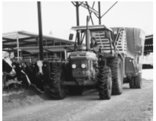
今年は全国ホルスタイン共進会が栃木県で開催