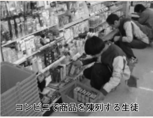
コンビニで商品を陳列する生徒