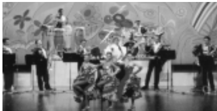
ペレス・プラード楽団

マンボの王様、ペレス・プラードがやってきます。マンボといえば思い出す「あーー、うっ！」が聞けるかも？ラテンダンスを那須野が原で活躍する地元トップ・プロダンサー2組が共演します。