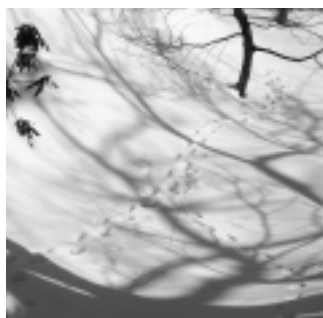
ずっと続く足跡を追って!

～追伸～ アニマルトラッキングについて知りたい方は、塩原温泉ビジターセンター(☎0287(32)3050)まで連絡ください。