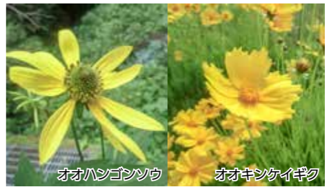
オオハンゴンソウ オオキンケイギク