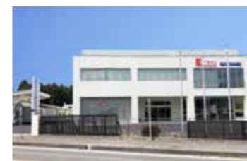
金子メディックス株式会社 (槻沢342番地17)

弊社はとても働きやすい会社だと思っています。会社全体が明るい雰囲気、上司や先輩、後輩とも仲がいいです。特に先輩には入社時から何でも教えてもらい、本当にお世話になっていました。私もこれからさまざまな知識を身につけて、多くの経験を積み、先輩方のような頼れる存在になっていきたいです。