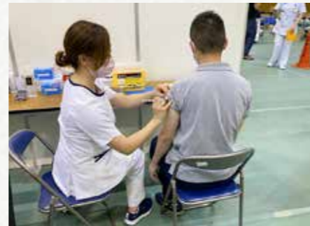
新型コロナウイルスワクチン接種