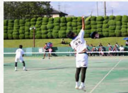
いちご一会とちぎ国体・とちぎ大会の開催