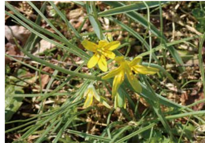
キバナノアマナ 撮影日:2020.4.9 撮影場所:藝沼

野山には、もうすぐたくさんのお花が咲き出します。今回紹介するのは、春に咲く花キバナノアマナです。木の俣園地や藝沼の水田のあぜなどをよく見て歩くと、少し白っぽい緑の細い葉に明るい黄色の花が見つかります。