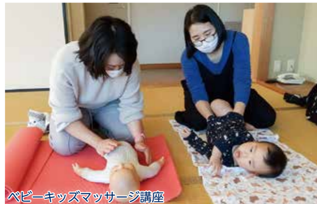
ベビーキッズマッサージ講座