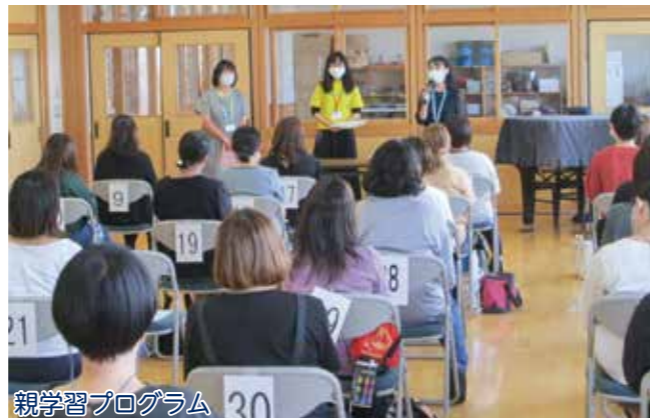
親学習プログラム