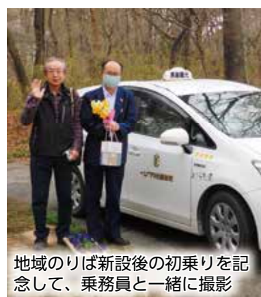
地域のりば新設後の初乗りを記念して、乗務員と一緒に撮影

実際に地域のりばが新設されると「買い物に楽になった」「元気なうちからゆータクに慣れておきたいね」という声が聞かれるように。ときには会員同士で乗り合わせて出かけた「ゆータク利用体験記」を共有したりと、住民自身がより良い活用方法を模索しています。「LINEで予