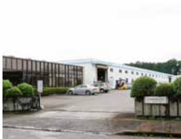
泉鋼管株式会社(四区町1532-1) 【業種】製造業 【業務の内容】精密引抜鋼管の製造 【問い合わせ】☎0287(36)4147

弊社では、Rizum20という活動を行っています。「C改善活動」や、「あいさつ運動」、「技能継承」がその中で、社員全員で取り組んでいます。私はこのような活動が行える社内環境をととても大切に思っていますし、その環境を作ってくれている会社にととても感謝しています。従業員の平均年齢は39歳。年功序列という考え方はありません。みんな協力して、より良い製品を提供し、会社と共に成長していきたいです。