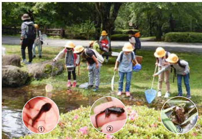
①オタマジャクシ ②手足の生えたオタマ ③チビガエル 撮影日：2021.6.25 撮影場所：箱の森プレイパーク