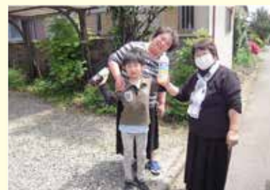
お届け事業は会員との交流にもなります