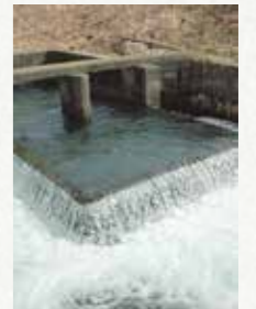
蛇尾川サイホン出口 73/178

那珂川から流れ、那須野が原を潤す那須疏水。西那須野に水を届けるためには、蛇尾川を横断しなければなりません。川床の下を通すトンネル、伏越には、高い技術と先人の偉業の歴史があるのです。