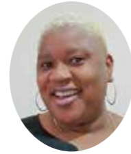
鍋掛小学校 カミカ 先生 ジャマイカ出身