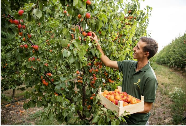
杏子の農園