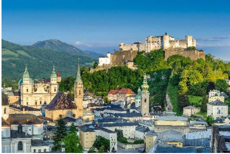
ホーエンザルツブルク城