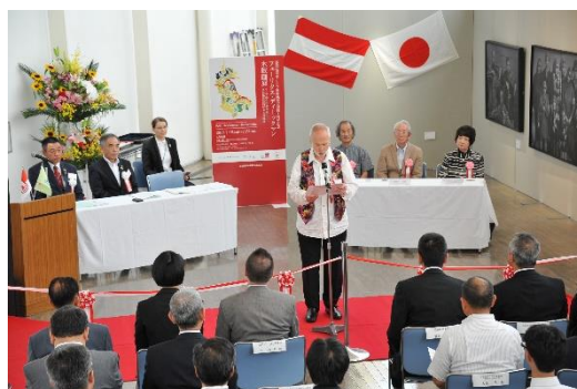
2017年の姉妹都市提携 1周年記念事業の木版画展のオープニングセレモニー

(足湯を見たときには、お湯が流れる噴水のように見え、とても不思議でした。)腰を下ろして、靴下を脱いで足をお湯