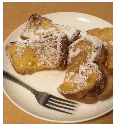
2人分のレシピを 作ってみた様子