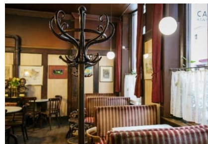
カフェ・ハヴェルカ

オーストリアの首都ウィーンのカフェハウス(喫茶店)が有名です。伝説によると、初めてのカフェハウスができたのは、オスマン帝国の軍が1683年にウィーンを包囲した頃です。オスマン帝国が退陣したときに、コーヒー豆を忘れてってしまったそうです。その豆を使って、ウィーンのカフェハウスが誕生したと言われています。やがて、ウィーンの一部となりました。特に19世紀には、カフェハウスは文化と社会的な生活の中心でした。有名な作家、建築家、政治家などは、なじみのカフェを第2のホームとしておりました。新聞を読んだり、カードゲームをしたり、手紙を自分の住所の代わりになじみのカフェ宛に送ってもらった人もいたそうです。現在も、観光地から離れたカフェハウスでは、コーヒー1杯だけを注文して、大理石のテーブルで数時間ゆったりと過ごしながら、昔の雰囲気を肌で感じることができます。2011年、ユネスコの無形文化財に「ウィーンのカフェハウス文化」が登録されました。日本ではよく「ウイナーコーヒー」を見かけますが、ウィーン特有のコーヒーは20種類ほどあり、その中には「ウイナーコーヒー」はありません。牛乳とクリームいっぱいのコーヒーなら、「フランツィスカナー」がおすすめです。カフェラテに近い「メランジュ」もおいしいです。コーヒーのお供には、色々な種類がある、オーストリアのケーキがぴったりです。カフェハウスの朝ごはん(喫茶店によって午後までに出す)や軽食もおいしいです。カフェハウスのウエーターはクールなイメージですが、あんまり気にしなくてもいいと思います。ラッキーだったら、逆にウィーンのお茶目な姿も体験できます。