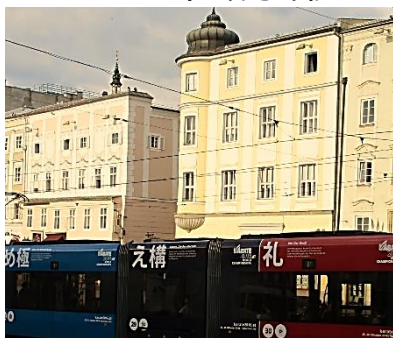
リンツ市で発見した日本語の文字

オーストリアで人気がある日本の文化は、結構前から流行っている日本の武道です。姉妹都市リンツ市でも、合気道、空手、武術、剣道、弓道のクラブや道場があります。