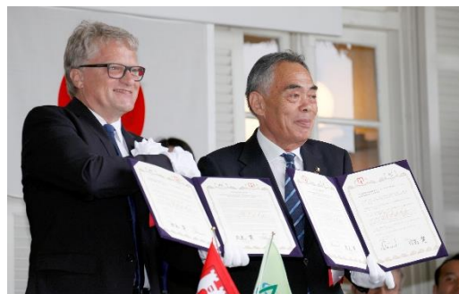
2016年旧青木家那須別邸で行われた姉妹都市提携調印式 (ルーガー市長 & 君島市長)

那須塩原市とは、数年間にわたって継続的な交流が続いています。現地では、那須塩原市にある観光的・産業的なポテンシャルを見てきました。両市は姉妹都市交流を活発に実施しています。