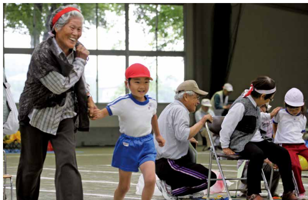
体に染みる競技後の巻狩鍋 歓声に沸いたゴールシーン