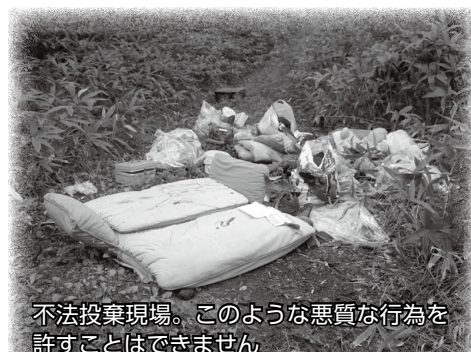
不法投棄現場。このような悪質な行為を許すことはできません