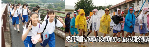
②熊川の源流を訪ねてin東那須野