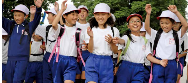
③Walk Walk 強歩in日新