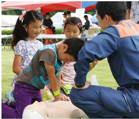
消防まつりでは、いろいろな催しを開催。初めての心臓マッサージにドキドキ