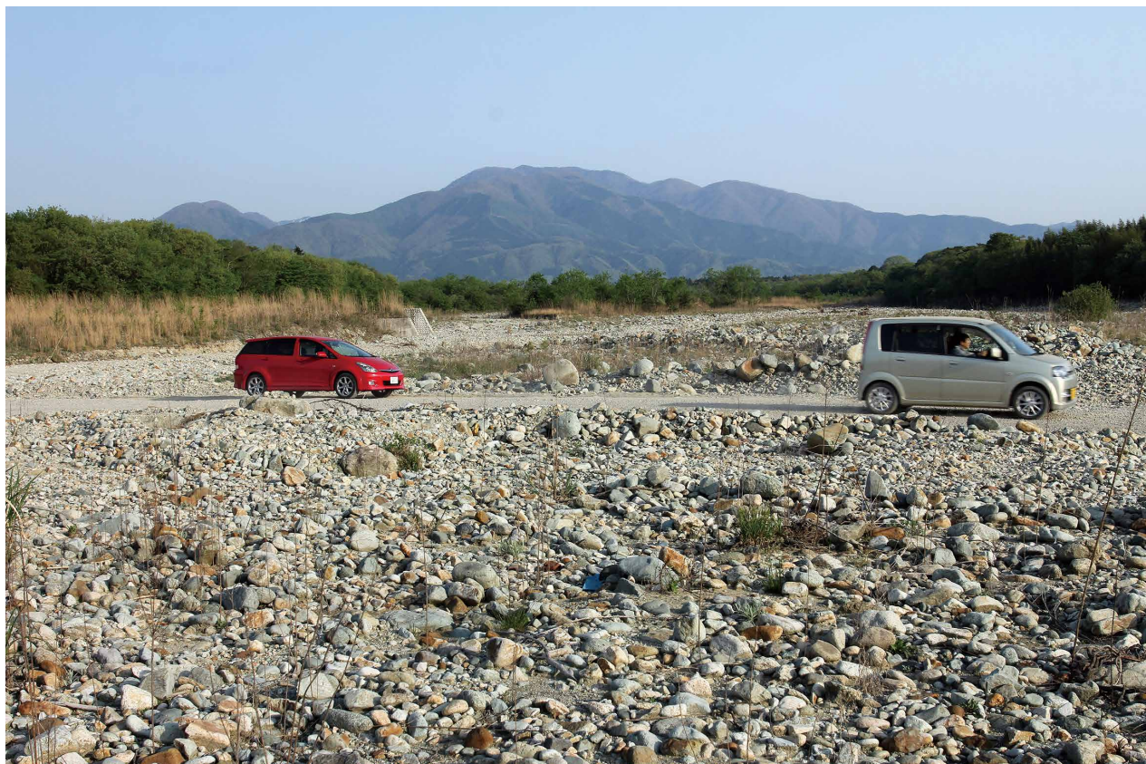
蛇尾川の河原を横断する道路 撮影日時:2015/5/2/6:59 撮影場所:上横林