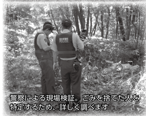
警察による現場検証。ごみを捨てた人を特定するため、詳しく調べます