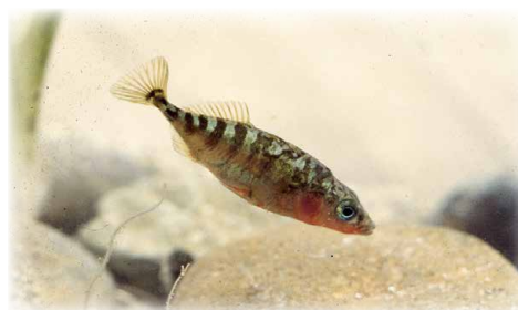
清川にすむイトヨ