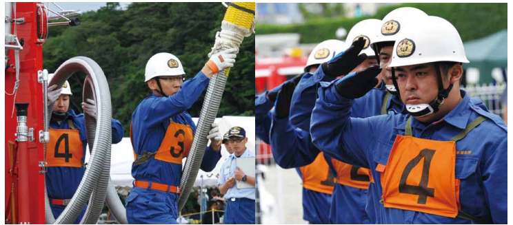
存分に練習の成果を出し切った各消防団 黒磯（左上）、西那須野（右上）、塩原（下）

現在、市内の消防団では一緒に活動してくれる人を募集しています。消防団に興味のある人は、近くの消防署や分署に連絡してください。