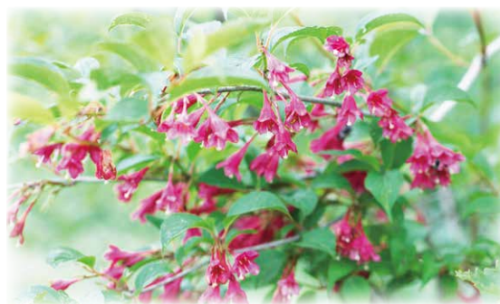
真っ赤なベニバナニシキウツギ