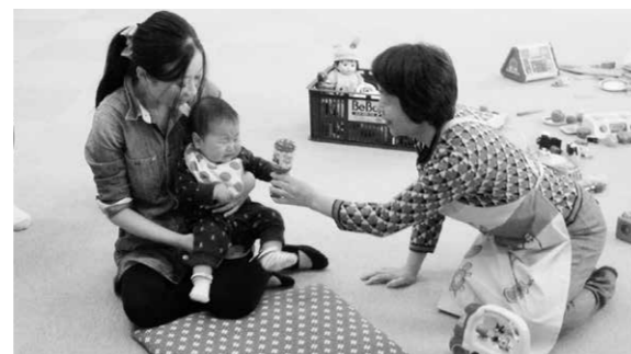
子育てサロンで活動する母子保健推進員

30・35歳節目健診時に、託児のボランティアを行っています。また、地域の子育てサロンにも協力しています。