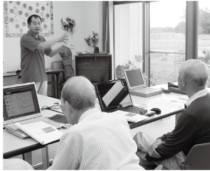
いきいき活動クラブでパソコン教室