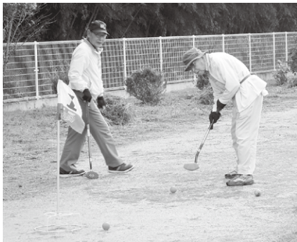
グラウンドゴルフでリフレッシュ