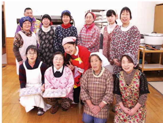
「まんじゅう作り教室」に参加した皆さん