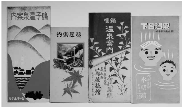
温泉地のパンフレット

はるか昔からたくさんの人たちを癒してきた温泉。現在も多くの人に愛され、親しまれています。今回の企画展では、ユーモラスな錦絵や、温泉地の様子を詳細に描いた風景図や鳥瞰図、温泉地を写した絵葉書、いろいろなパンフレットなどを中心に紹介します。