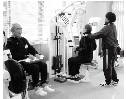
マシンを使った筋力トレーニング