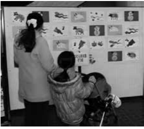
絵画作品展示の様子