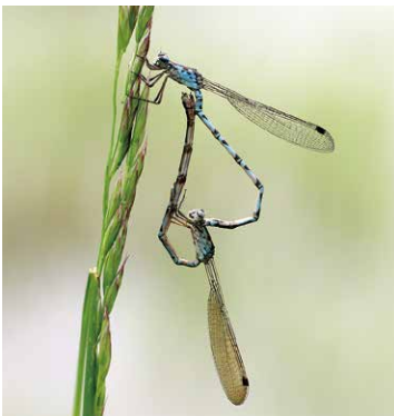
ホソミオツネントンボ

今回は、冬に見られる珍しいトンボを紹介します。その名もオツネントンボ。漢字では「越冬蜻蛉」と書きます。ほとんどのトンボは卵や幼虫(ヤゴ)で冬を越しますが、オツネントンボは成虫のまま冬を越します。寒さに強く、少しくらい雪に埋もれてもへっちゃらです。 体長は4cm程の小さなトンボで、色は淡い褐色をしています。小枝にそっくりで、じっとしていると見つけるのに苦労します。よく似た種類に、ホソミオツネントンボがありますが、こちらは成熟すると美しい空色に変わります。2種類とも、春の田