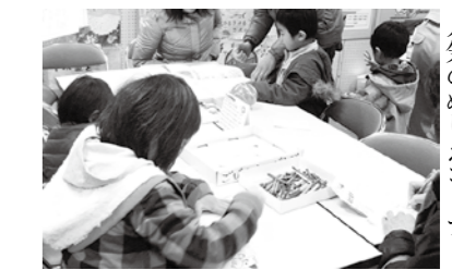
人気のぬりえコーナー