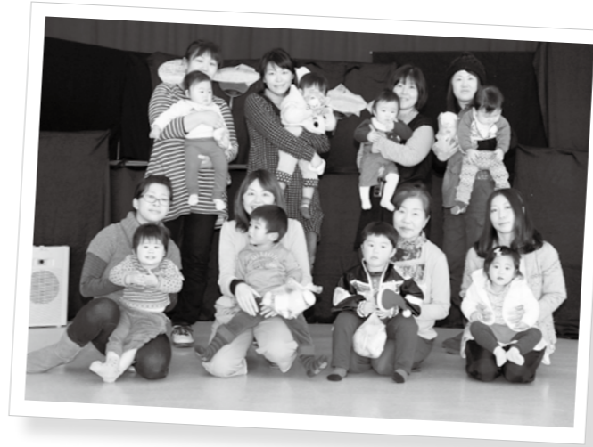
12月19日の子育てひろばに参加した8組16人の皆さん。この日はクリスマス会が行われ、みんなで人形劇を観賞しました。