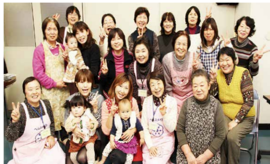
米粉でヘルシークッキング参加者の皆さん