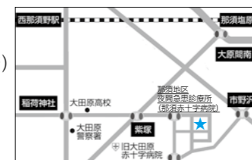
※那須地区夜間急患診療所は那須赤十字病院とは別の医療機関です。