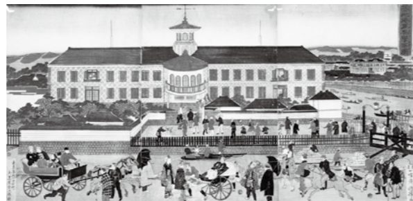
築地海軍英学寮図