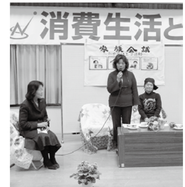
昨年の環境劇「我が家のエコ活動」

遊んで得しちゃおう！ 身近な消費生活や環境の問題を子どもから大人まで楽しく学べるイベントです。マイバック持参で遊びにきてください！（エコのため、資料の配布袋を自粛しています）