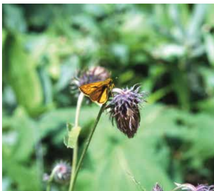
コキマダラセセリ

この一見するとガ類に見えるのはセセリチョウ科のコキマダラセセリとキマダラセセリです。種名のおおりに、羽は黄色を帯びています。前者は市内では山地性の種で、だいたいの標高500m以上の地域に生息していますが、西那須野地区にも発生地があります。河原や、草が主な生息地です。幼虫はイネ・カヤツリグサ・タケ科の葉を食べて成長します。成虫は、年1回7月前後に発生します。成虫は、後者は平地から低山地に分布し、