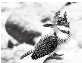
ヤマセミ