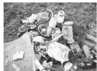
不法投棄された現場

市民の協力で行われている市民一斉美化運動、団体や企業が実施している清掃活動などにより、周辺環境の美化が進んでいます。その一方、一部のモラルのない人によるごみの不法投棄が後を絶ちません。空き缶などのポイ捨ても不法投棄になります。不法投棄物の撤去・処分は、行為者が判明しない場合、土地の管理者が行わなければならない、処分費用も負担しなければなりません。土地を所有・管理している人は、ごみを捨てられないような環境づくりを行い、適切な土地の管理をすることが重要です。