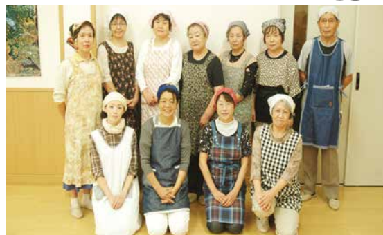
知って得するセミナー受講生の皆さん