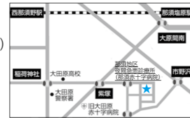
※那須地区夜間急患診療所は那須赤十字病院とは別の医療機関です。

ところ 大田原市中中原1081-4 (那須赤十字病院本館1階) 診察科目 内科、小児科 診療日時 毎日午後7時～10時 ☎0287(47)5663