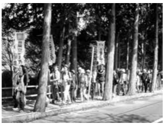
昨年開催した那須野が原ウォークの様子

とき 9月29日(土)午前9時～正午(受付は午前11時30分まで) ところ 北那須浄化センター 内容 大田原市宇田川1790-1 下水道に関するポスター展や表彰式、浄化センター施設見学、水質試験にチャレンジ、ミニSSL運行、スタンプラリー、ポップコーン無料配付など ※スタンプラリーチケット達成者およびアンケート回答者に記念品を用意しています。 問い合わせ 田園空間博物館運営協議会事務局(国産業観光建設課) ☎(37) 5108