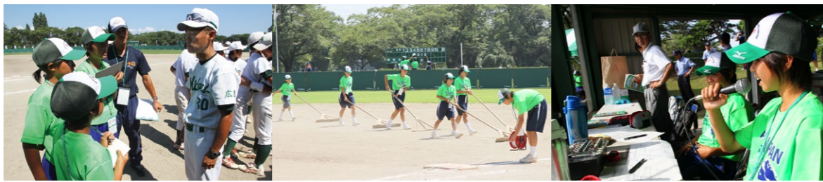
勝利チームの監督にインタビュー

大会には市ソフトボール協会の協力のほか、東北地区の中学生約180人が大会運営の裏方として活躍しました。