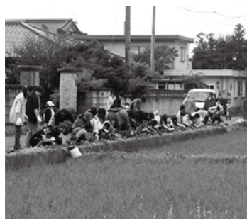
マリーゴールド植栽の様子

平成19年度、地域の農村環境を守る団体として「三区町環境保全隊」が発足しました。「好きです! 那須疏水と緑豊かな郷・三区町、守りま