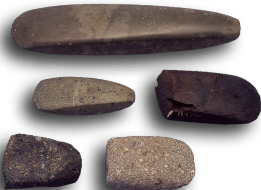
いろいろな磨製石斧