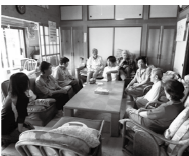
「ひなた」の日常風景

特徴としては認知症に特化したデイサービスを実施しており、「日常生活動作そのものが機能訓練である」という考えのもと、料理の補助や洗濯たたみ、ごみの分別など、