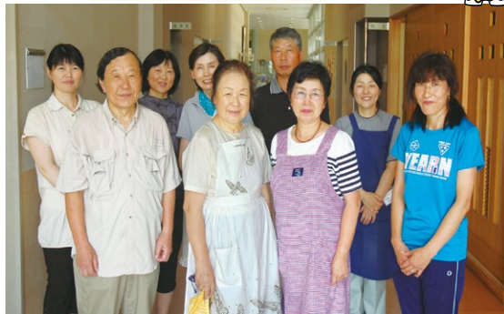
槻沢郷土料理研究会の皆さん