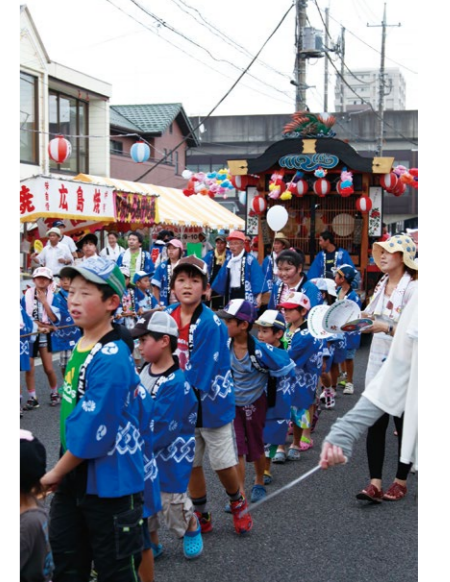
遅沢ばやし保存会の山車