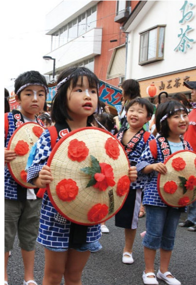
永田保育園の園児による花笠おどり