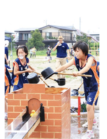
プレイベントの疏水レース