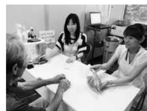
依頼者から前処理済みの検体を預かる様子

利用者の声 家庭菜園で収穫した野菜を何度か検査しました。最初は、どんな結果が出るかドキドキしましたが、キュウリ、キャベツなど8種類の検査結果はすべて「不検出」で、安心しました。これなら胸を張って人にあげることが出来ます。1kg分の野菜の前処理は、慣れればそれほど苦にはなりません。こ