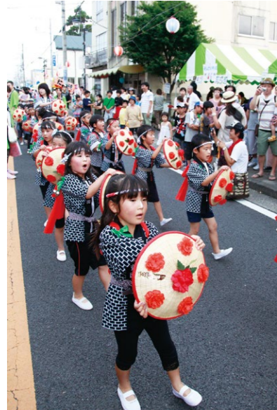
三島保育園の園児による花笠おどり