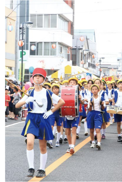
大山小学校の児童による鼓笛隊