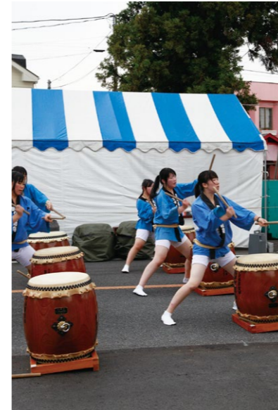
那須野ヶ原疏水太鼓