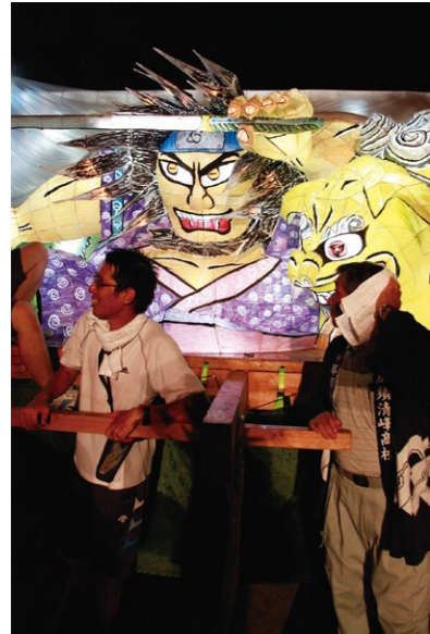
那須清峰高校のねぶた