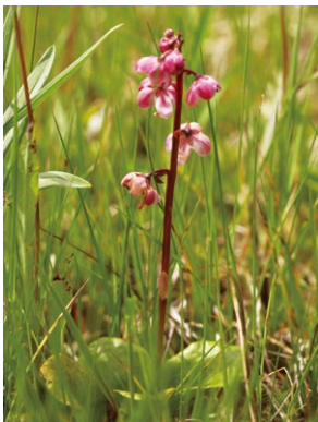
ベニバナイチヤクソウ

お盆を過ぎると高原はもう少しで秋を迎えます。夏の花が終わる前に山歩きをしておきましょう。 汗をかきながら歩く山で見る植物は最高ですね。しかもそれが初めて見る花だったら興奮してしまえます。 今ごろ沼ッ原で見られる花は、サワギキョウやアケボノソウ、リンドウやトリカブトなどです。是非出かけて探してもらえたらと思います。 今回紹介するのは、イチヤクソウとベニバナイチヤクソウです。どちらもイチヤクソウ科イチヤクソウ属の多年草です。葉を持ち光合成を行います。半寄生植物です。 イチヤクソウという名前は、1本