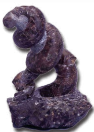
ユーボストリコセラス(北海道夕張市)