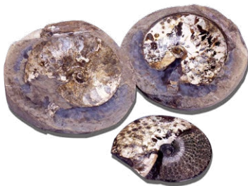
プラセンチセラス(アメリカ)