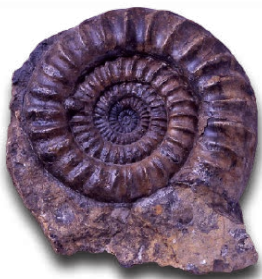
アリエタイテス(ドイツ)