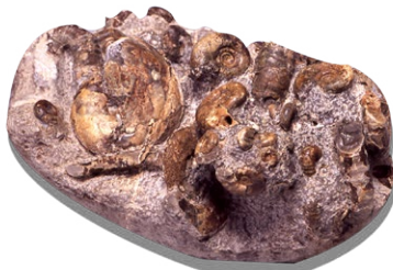
ゴードリーセラス他(北海道羽幌町)