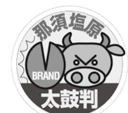
↑那須塩原ブランド認定マーク

地域の産業を活気づけ、知名度を上げる方法のひとつに「特産品のブランド化」があります。地域の歴史や文化に支えられたものや、地域の気候、風土を生かしたものなどが、それぞれの地域のブランドになっていきます。本市にも「那須塩原らしさを持った特産品」がたくさん