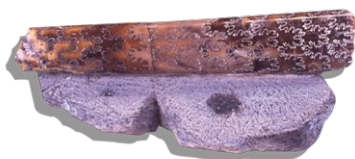
バキュリテス(アメリカ)

那須野が原博物館では、国内外の化石標本約250点を収蔵しています。今回はその中からアンモナイトを紹介します。