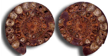
ペリスフィンクテス(マダガスカル)